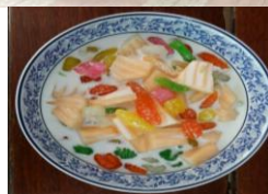
ขนมรวมมิตร