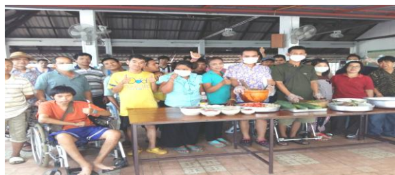
ส้มตำแซ่บเวอร์